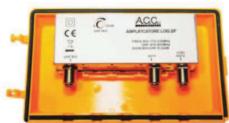
K104 LOG 2/F