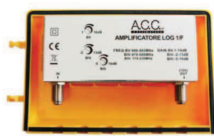
K103 LOG 1/F