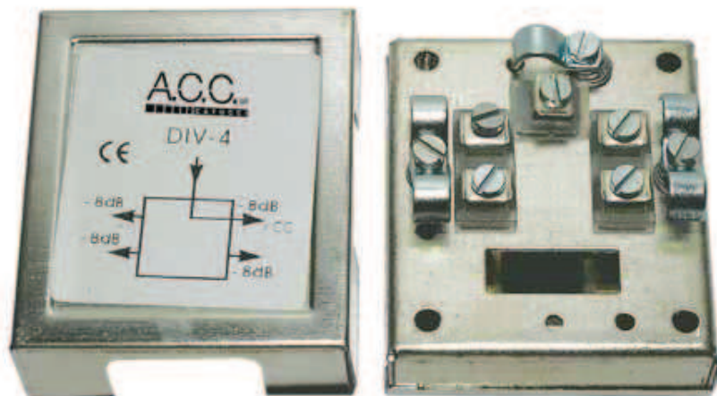
K126 DIV 4